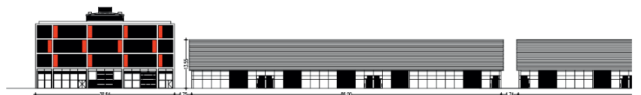
3. FAÇANA CARRER