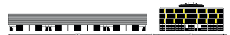
4. FAÇANA CARRER